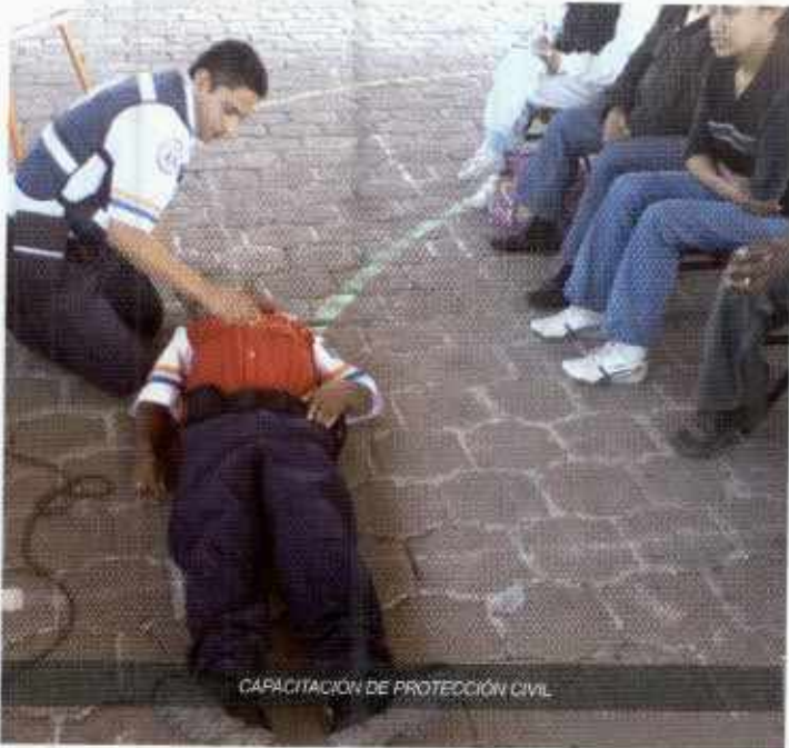
CAPACITACIÓN DE PROTECCIÓN CIVIL

De igual manera apegado a los ejes rectores del Gobierno del Estado esta Dirección de Seguridad Pública ha asistido a 14 capacitaciones y diversos cursos que harán tener elementos con