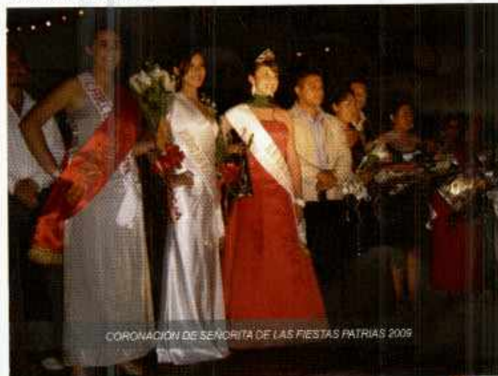
CORONACION DE SEÑORITA DE LAS FIESTAS PATRIAS 2009

La Casa de Cultura "Malinalxochitl" ubicada en esta cabecera municipal, ha llevando a cabo hasta el momento 24 talleres abiertos al público a los que asisten 120 alumnos diariamente, además de brindar atención los fines de semana con un promedio de 70 personas niños y adultos. Realizando también 4 exposiciones de arte, así como presentación y coronación de la Srita. Reina de las fiestas patrias 2009, eventos de día de muertos y 20 de noviembre.