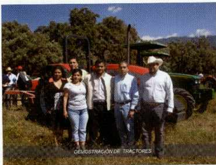
DEMONSTRACIÓN DE TRACTORES

La competencia de esta dirección, en conjunto con la 6ta. Regiduría es fomentar el desarrollo agropecuario del municipio en sus distintos ramos, con la finalidad de mejorar la productividad de las actividades del campo por ser uno de los rubros mas importante de la sociedad derivado que nuestro municipio se compone por más del 70% en este sector por lo que se rehabilitaron 10 km. de brechas saca cosechas en el ejido de Platanar, y 10 Km. más de apertura en el mismo ejido, se han realizado hasta el momento 3 km. Rastreo de brechas saca cosechas, en San Nicolás estando en proceso 2 Km. más, se realizaron 100 metros lineales de encementado de canales de riego en los ejido de San Pedro Chichicasco y Platanar, así como la realización de 3 bordos en Platanar y San Andrés Nicolás Bravo, se distribuyeron 480 dosis de vacunas de triple bacterina y 280 para el derriengue, ambas subsidiadas al 50% beneficiando a 8 comunidades, se impartieron 5 cursos, en diferentes rubros del campo atendiendo a más de 390 personas interesadas, se llevó acabo una demostración de tractores e implementos a los habitantes del municipio, se brindo asesoría y asistencia técnica a todos los productores del Municipio