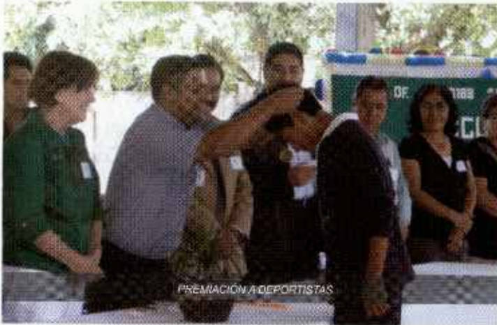
PREMIACIÓN A DEPORTISTAS

En el área deportiva se han llevado a cabo hasta el momento: 1 Caminata con personas de la tercera edad, 4 Carreras atléticas con el nivel de Secundaria, 1 cuadrangular de futbol en el nivel medio superior saliendo como campeón el CECyTEM que dignamente nos representó en la Olimpiada Regional en Tenancingo.; 2 cuadrangulares de futbol y basquetbol varonil y femenino del nivel de secundaria en la parte Norte y Sur del municipio y participación en la Olimpiada Regional en Tenancingo.; 1 exhibición de KARATE y Promoción de activaciones físicas a personas de la tercera edad en la Cabecera municipal y San Simón el Alto.