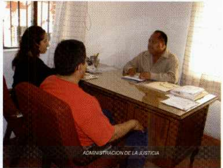
ADMINISTRACION DE LA JUSTICIA

Se asume como la relación directa con la unidad administrativa de apoyo jurídico del municipio, misma que acercará los conocimientos técnicos y legales para una ejecución de los casos en los que prevalezcan la razón y la justicia. Durante el período de los cien días de trabajo se han atendido a 498 ciudadanos de la siguiente manera: 57 Controversias resueltas en conciliación, 135 Citatorios enviados, 120 Asesorías jurídicas, 22 Actas informativas, 15 Actas de mutuo respeto, 14 Convenios, 5 Deslindes y verificación de medidas y colindancias, 16 Liquidaciones por término de relación laboral, 3 Prorrogas de concesiones de agua potable.