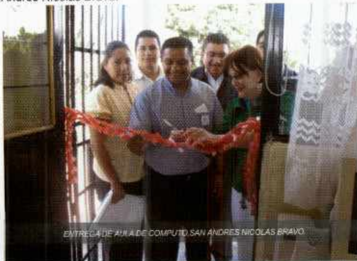
ENTREGA DE AULA DE COMPUTO, SAN ANDRES NICOLAS BRAVO

Dentro de las actividades que esta Dirección lleva a cabo, está el aspecto de la Educación, y es bien sabido por todos que para que se logre un desarrollo efectivo de cualquier sociedad es necesario, que ésta esté preparada, que tenga un nivel adecuado de que le permita aspirar a una mejorar calidad de vida. Por lo anterior, en nuestro municipio día a día se realizan trabajos de diagnóstico, así como gestión de equipamientos como el de UNETE para la escuela secundaria "Naciones Unidas" de San Andrés Nicolás Bravo.