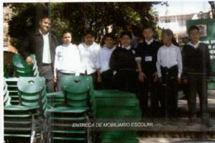
ENTREGA DE MOBILIARIO ESCOLAR

Así como la entrega de libros para reforzamiento ,reuniones mensuales con los directores de todas las Instituciones educativas, capacitación de Derechos Humanos, Conferencia sobre manejo de residuos sólidos, así como la coordinación de las ceremonias cívicas a festejar en la Cabecera municipal. También se ha dotado de mobiliario y materiales didácticos a 9 planteles del nivel de Preescolar, 8 Primarias, 2 telesecundarias y 2 bibliotecas públicas municipales, logramos inaugurar e instalar aulas de medio en las comunidades de San Andrés y Amate Amarillo y ratificar el personal de apoyo a la mayoría de las Instituciones por parte de este Ayuntamiento.