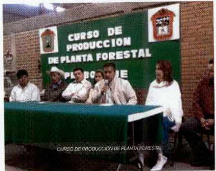
CURSO DE PRODUCCIÓN DE PLANTA FORESTAL

Es el área de procurar el mayor rendimiento de los recursos mediante los mecanismos de racionalidad, con eficiencia y eficacia; así como de encaminar las acciones tendientes a la salvaguarda y mejoramiento del entorno ecológico en el Municipio, todo ello con total apego a las normas técnicas y jurídicas establecidas para ello. Sus acciones son las siguientes: 52 atenciones ciudadanas, 45 permisos de poda, derribe de árboles y traslado de leña seca; 5 denuncias personales y 2 denuncias vía telefónica; 6 cursos y capacitaciones; 16,500 árboles gestionados para reforestar ante PROBOSQUE y 3240 del Vivero Municipal; atención de 1 incendio en coordinación con Protección Civil y 45 supervisiones a las diferentes comunidades del municipio.