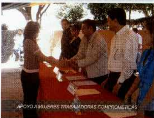
APOYO A MUJERES TRABAJADORAS COMPROMETIDAS