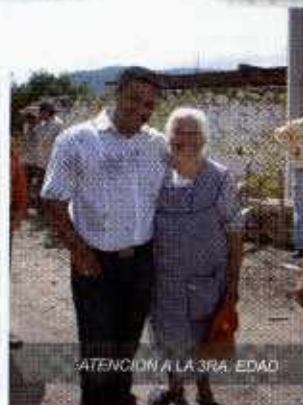
ATENCION A LA 3RA. EDAD